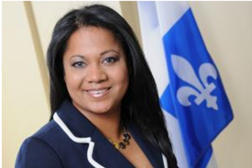
Dân biểu Hạ viện Canada Ève-Mary Thái Thị Lạc