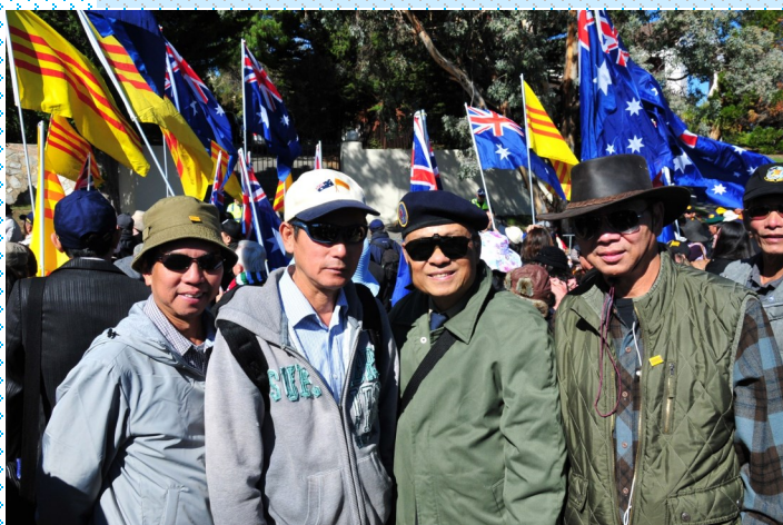
Tham gia biểu tình trước tòa đại sứ Việt Cộng tại thủ đô Canberra, Australia