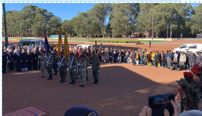
Lễ Thượng Kỳ và Mặc Niệm ở đài Tưởng Niệm Chiến Sĩ Úc Việt tại thủ đô Canberra sau khi biểu tình ở tòa đại sứ Việt Cộng