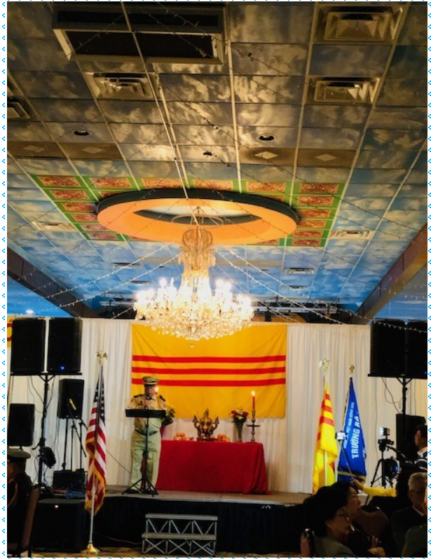
Ban Tổ Chức giới thiệu chương trình