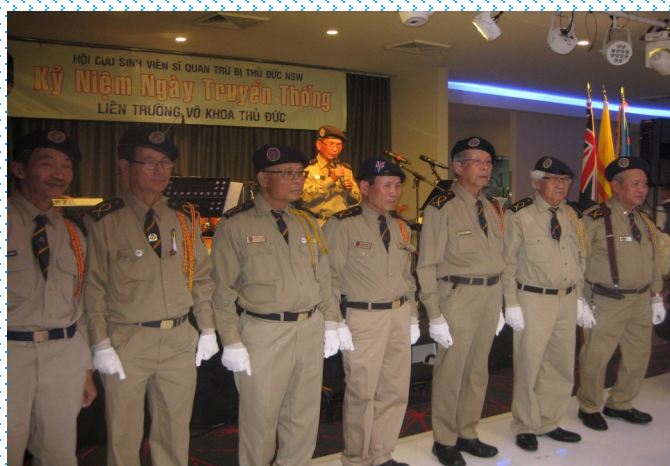
Các thành viên trong Ban Chấp Hành Hội nhiệm kỳ 2019-2021 ra mắt trong lễ kỷ niệm Ngày Truyền Thống lần thứ 68