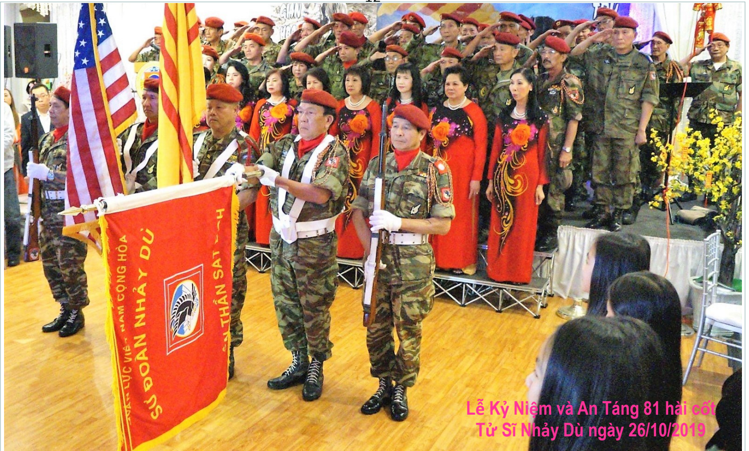
Lễ Kỷ Niệm và An Táng 81 hải cẩu Tử Sĩ Nhảy Dù ngày 26/10/2019