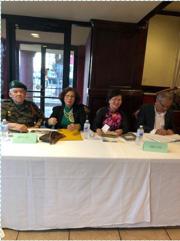
Bàn Tiếp Tân