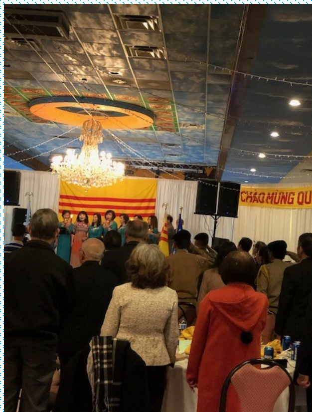
Quan khách tại địa phương đến tham dự