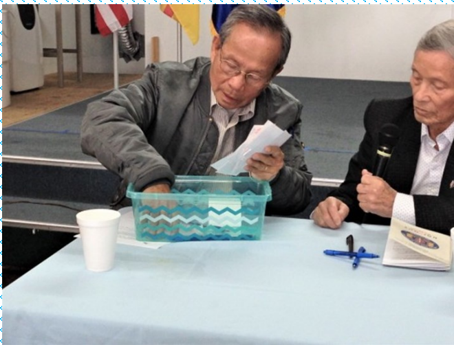
Kiểm phiếu ngay tại bàn Chủ Tọa Đoàn