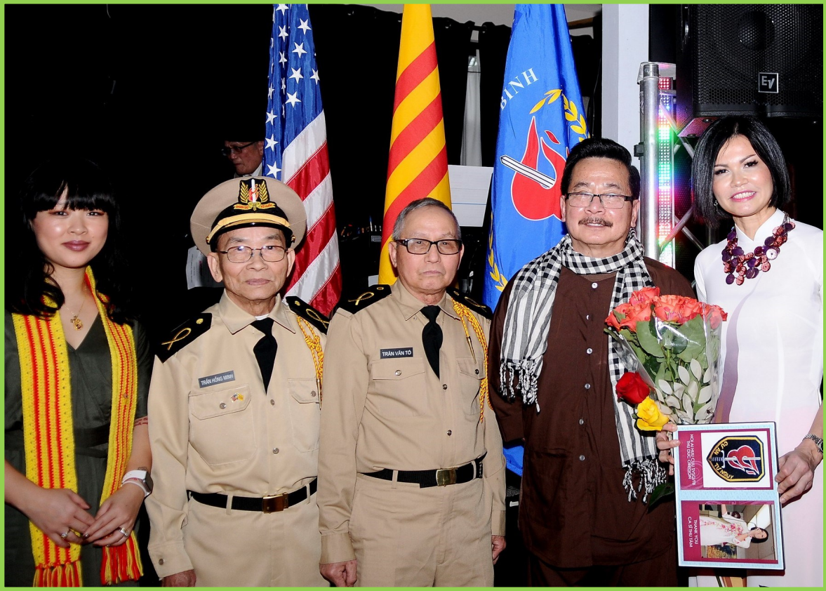
TIỆC TẮT NIÊN ÁI HỮU THỦ ĐỨC OREGON, 12/19/2019, PORTLAND, OR