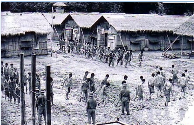
Hình: Cảnh một trại tù “Cải-tạo” của Cộng-sản Việt Nam sau 1975

Tù đói thì uống nước vào thay ngô Mồ-hôi-muối đầm áo tù Mất cay vị mặn tai ù không nghe Nắng lửa không mái lều che Trên đầu chỉ chiếc nón mê tự làm Ôm đầu chưa chắc được nằm Phải làm “việc nhẹ”: đào hầm, đào ao Mưa rừng miền Bắc! Ôi chao! Thấm vào da thịt như dao cắt lòng Mùa Đông lội xuống cánh đồng Hai chân buốt tựa vô thùng cà-rem! Gò lưng kéo chiếc bừa đen Một sau, hai trước lấm lem thân gầy Ấm no không ở chốn này Khổ-sai là đúng! Đọa-đày đúng hơn! Lên bờ được chút lửa rơm Gọi là nhân-đạo, nghĩa ơn dài dòng Quanh-co lý-luận lòng-vòng Cộng-sản áp dụng “nước sông công tù” Núi rừng Việt Bắc âm-u Mùa Đông thê-thảm, mùa Thu buồn-buồn Đêm nằm nghe vượn hú luôn Thân tàn co-quắp, chiếc giường rệp leo Chúa-nhật cái bụng càng ... “meo” Vì không bữa sáng, nằm queo đợi giờ Lạnh phân khoai sắn bữa trưa Bữa chiều dồn lại mới vừa bụng no! Những ai ăn khỏe như ... bò (to con lớn xác) Thăm nuôi bạn có nhường cho khẩu-phần Niềm vui được một, hai lần Gọi là đùm bọc tinh-thần giúp nhau Kể hoài cũng chẳng hết đâu Chuyện tù Cộng-sản kể lâu vẫn còn