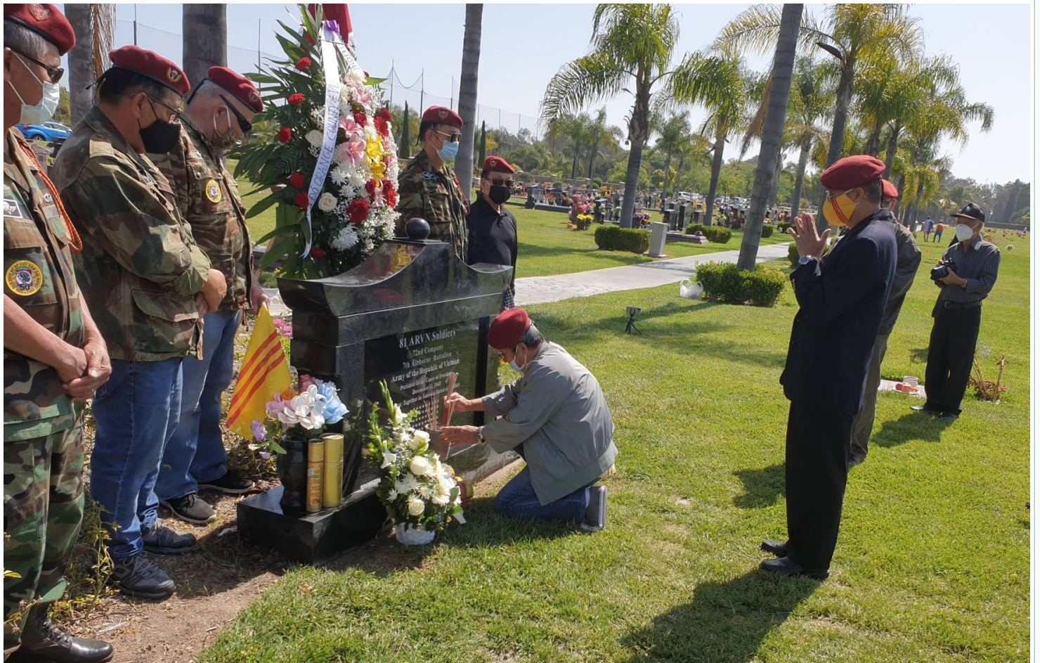
Các cựu quân nhân Chi Hội Mũ Đỏ Nam California Và Phụ Cận tưởng niệm các đồng đội trong ngày Lễ Chiến Sĩ Trận Vong. Memorial Day ngày 25 tháng 5, 2020 tại mộ 81 tử sĩ Anh Hùng Mũ Đỏ trong nghĩa trang Westminster Memorial Park