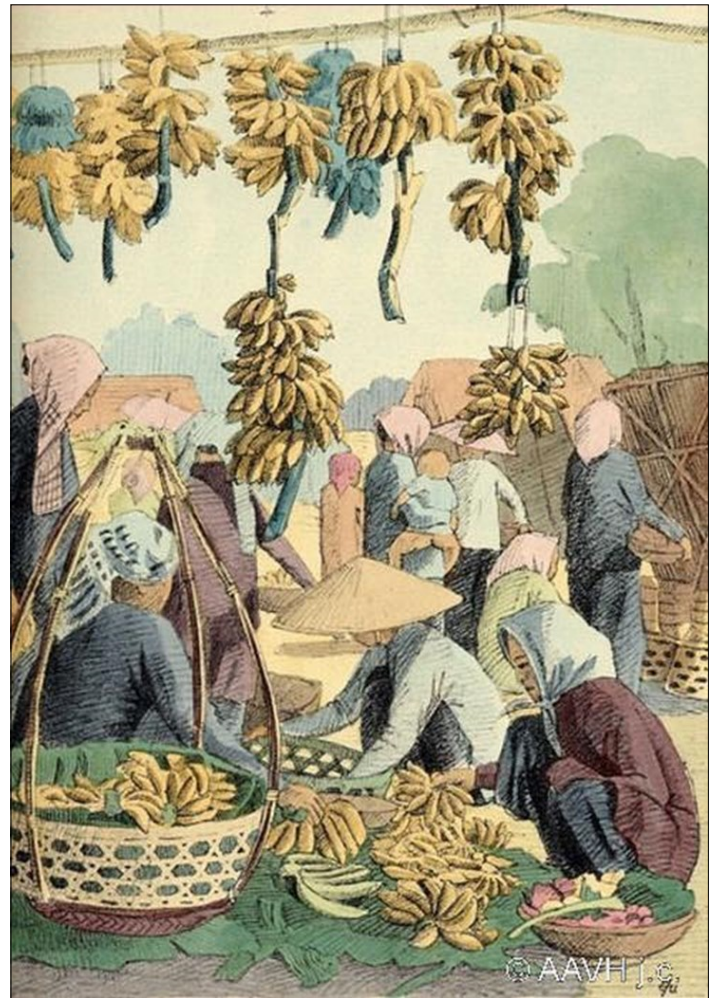
Một bức tranh trong bộ tranh “Người Miền Tây” do họa sĩ Lê Văn Hưởng cung cấp