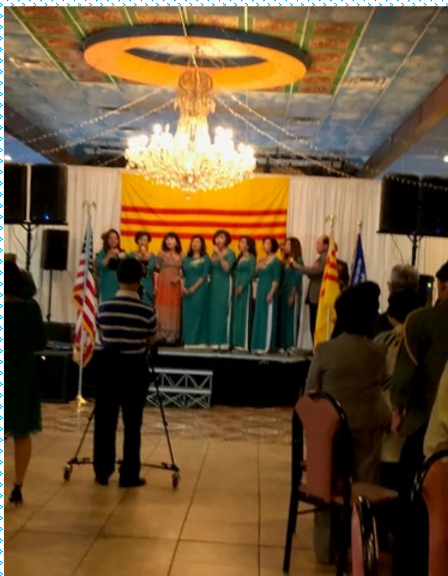
Hội Cựu Tù Nhân Chính Trị đồng ca