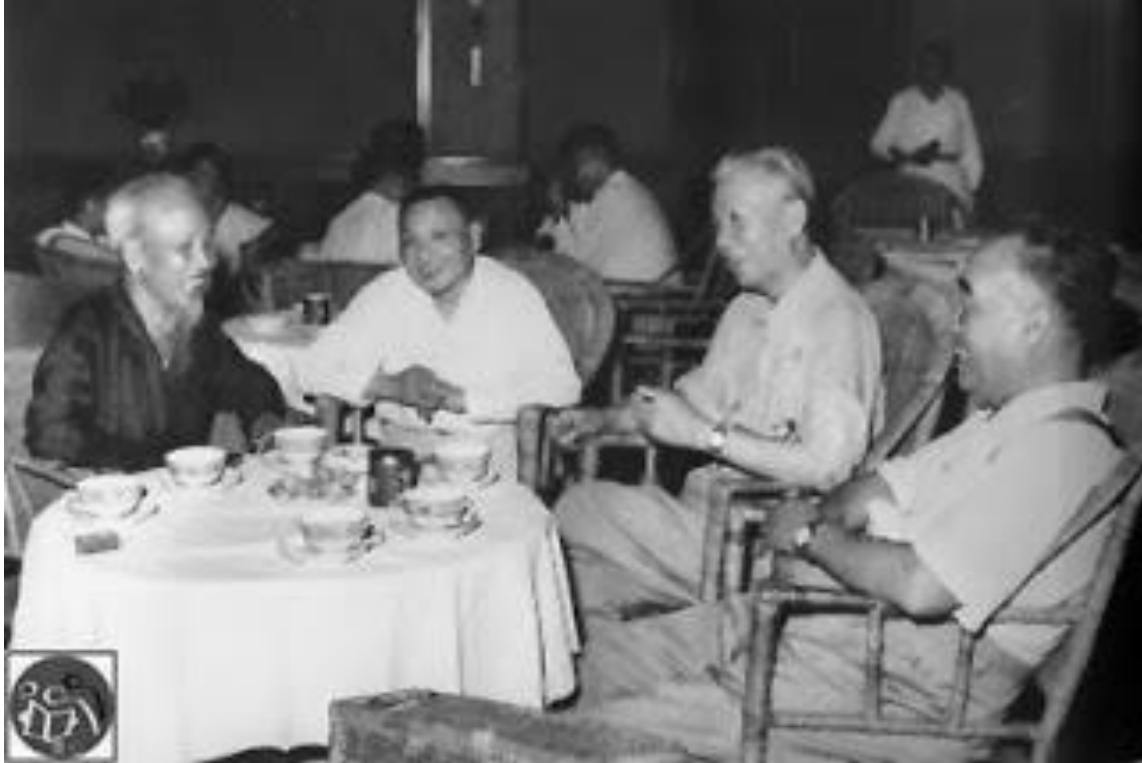
Tháng 6 năm 1958 Bắc Kinh, các nhà lãnh đạo Hồ Chí Minh, Đặng Tiểu Bình, Lưu Thiểu Kỳ, Chu Đức thân mật lo toan chuyện bán nước Việt Nam.

chính sách Đông Dương. Như trước đây cũng mô tả, các nhà lãnh đạo Đảng Cộng sản Trung Quốc rất quan tâm đến Việt Minh do Hồ Chí Minh lãnh đạo phong trào chống Pháp. Mùa xuân năm 1947, Trung Cộng và đảng Cộng sản Việt Nam, chính thức thành lập liên lạc vô tuyến. Mao sớm cho Hồ Chí Minh thấy rằng, ông là tương lai của mọi hỗ trợ khởi xướng tư tưởng ngoại giao Đông Dương.