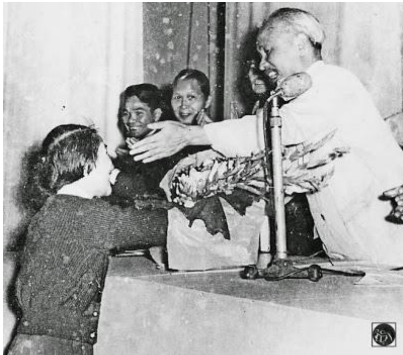
Những diễn viên múa Bắc Kinh được Hồ Chí Minh đặc biệt nhiệt tình chiếu cố.

Mao Trạch Đông vận dụng tối đa con cờ Hồ Chí Minh làm bàn đạp chống lại Tư bản, Cộng sản thường miệt thị chủ nghĩa thực dân hay đế quốc, Cộng sản cho rằng những ý tưởng mang tính cách mạng được bao gồm trong cuốn sách "cách mệnh chi lộ" đang lây lan từ Quảng Châu Trung Quốc sang Việt Nam. Chúng ta không thể phủ nhận rằng trong năm 1924-1927 Hồ Chí Minh người Trung Quốc có ảnh hưởng lớn tại Việt Nam. Trước đó, dù ông ta đã thấm nhuần lý thuyết Lenin Quốc tế vô sản, nhưng cuộc cách mạng của Trung Quốc mà ông tham gia "Phương Đông cách mạng" từ hoàn cảnh đó bắt đầu hoạt động trên quê hương của mình (Trung Quốc), Hồ Chí Minh gặp Chu Ân Lai làm những giao dịch mới, tiến đến ý tưởng tình đồng chí Vô sản Phương Đông.