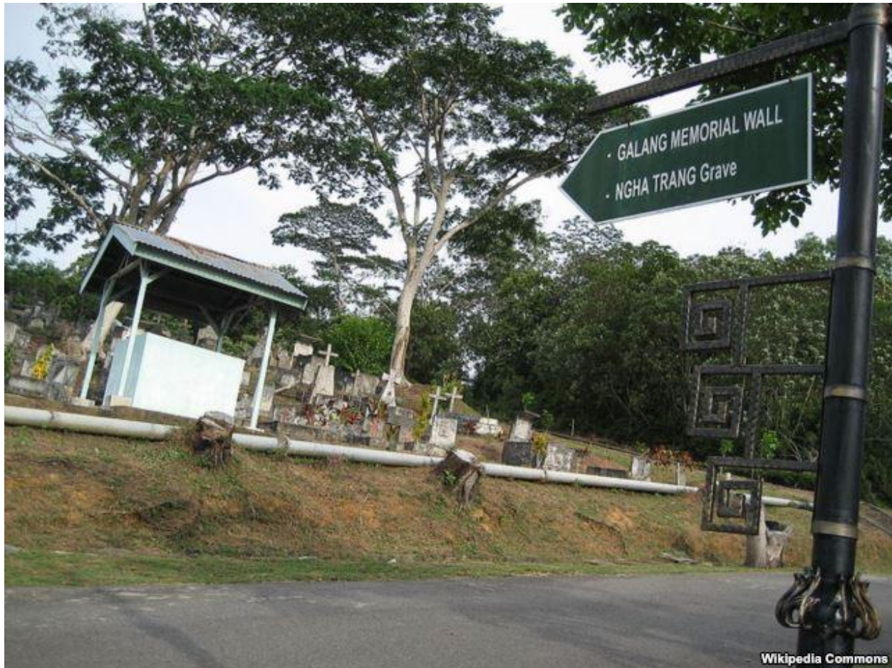
Khu mộ tưởng niệm các Thuyền nhân tị nạn ở Galang.

Thứ hai , trong một tập tài liệu ấn hành vào năm 2000, mang tựa đề "The State of the World's Refugees 2000, 50 years of Humanitarian Action," viết về tình trạng tị nạn thế giới, để đánh dấu 50 năm hoạt động nhân đạo của Liên Hiệp Quốc, Bà Sadako Ogata, Cao Ủy Trưởng Tị Nạn Liên Hiệp Quốc, đã nói về lòng can trường của hàng triệu người tị nạn và lánh nạn trên thế giới đã mất tất cả, ngoại trừ niềm hy vọng, và đã vượt qua biết bao thử thách và chông gai để đi tìm con đường sống. Bà Ogata đã tuyên dương những người này là "Những người sống sót vĩ đại của Thế Kỷ 20" . Cuốn sách cho biết: