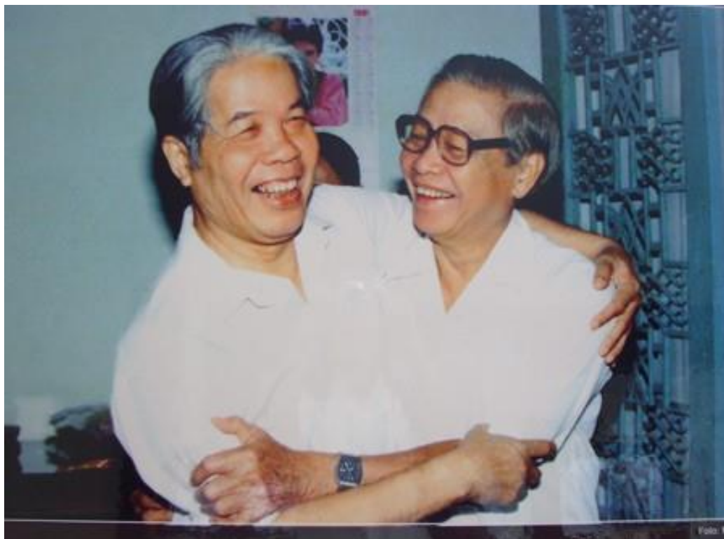
Đỗ Mười và đàn em Võ Văn Kiệt vui mừng vì cướp được của nhân dân Miền nam