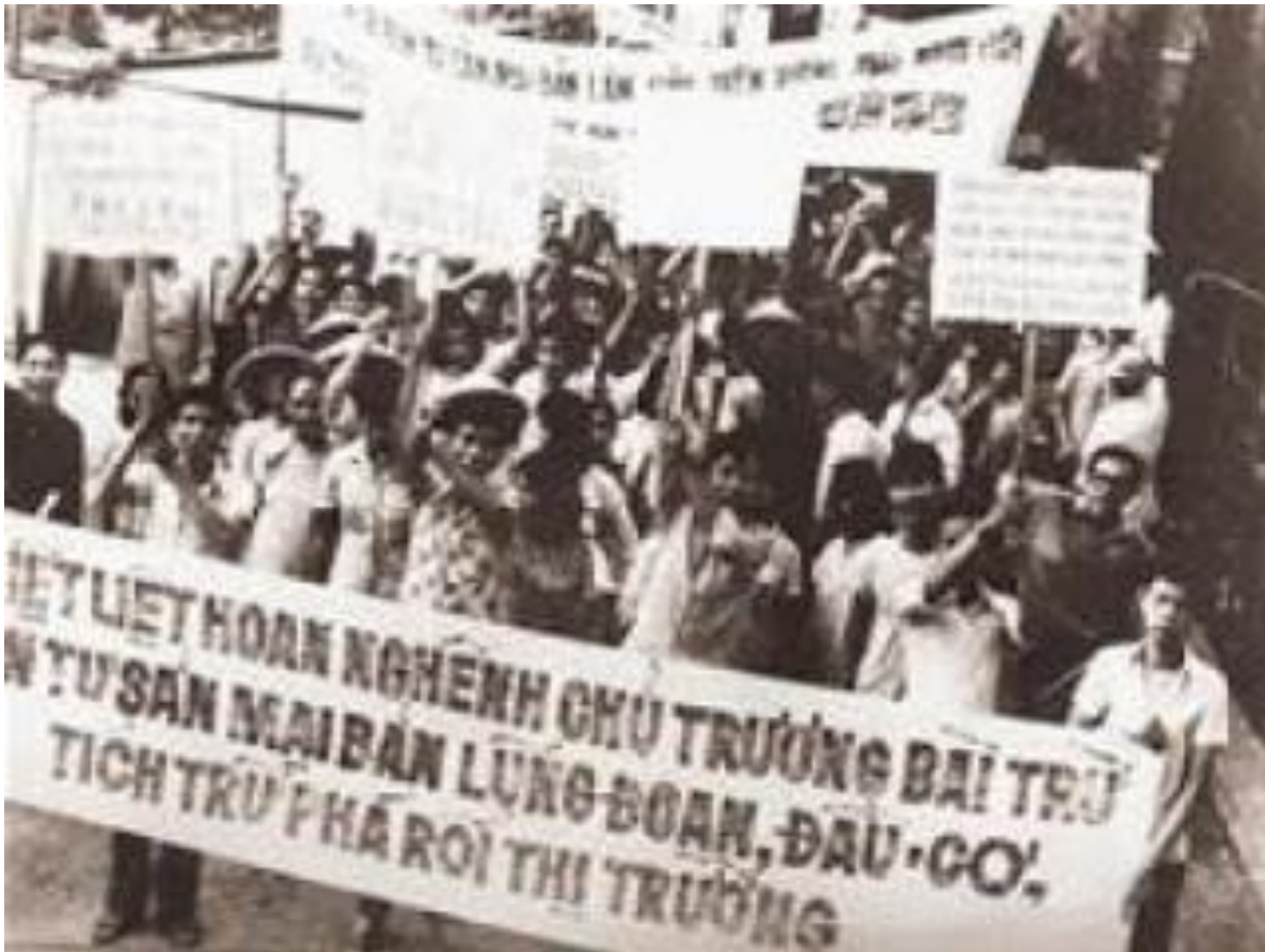
Đánh Tư sản sau năm 1975

các kho, để rồi không cánh mà bay, hoặc biến thành phế thải. Xin quý vị theo dõi những chứng cứ dưới đây để thấy được sự thật này.