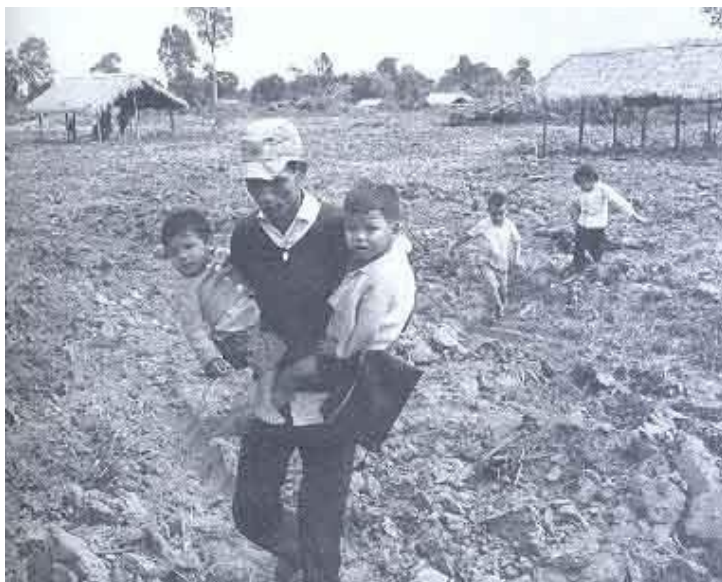
Đánh Tư sản, đuổi dân đi Kinh tế mới

Đảng Cộng Sản không cung cấp phương tiện sản xuất và nhà cửa cho nhân dân. Trái lại còn đẩy họ đi khỏi thành phố lao động khổ sai với nhãn mác "đi vùng Kinh tế mới".