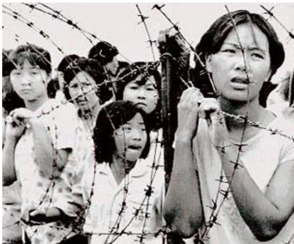
Đôi mắt thất thần của những người Việt trong Trại tỵ nạn

http://www.youtube.com/watch?v=P5Tjq1NtIoA