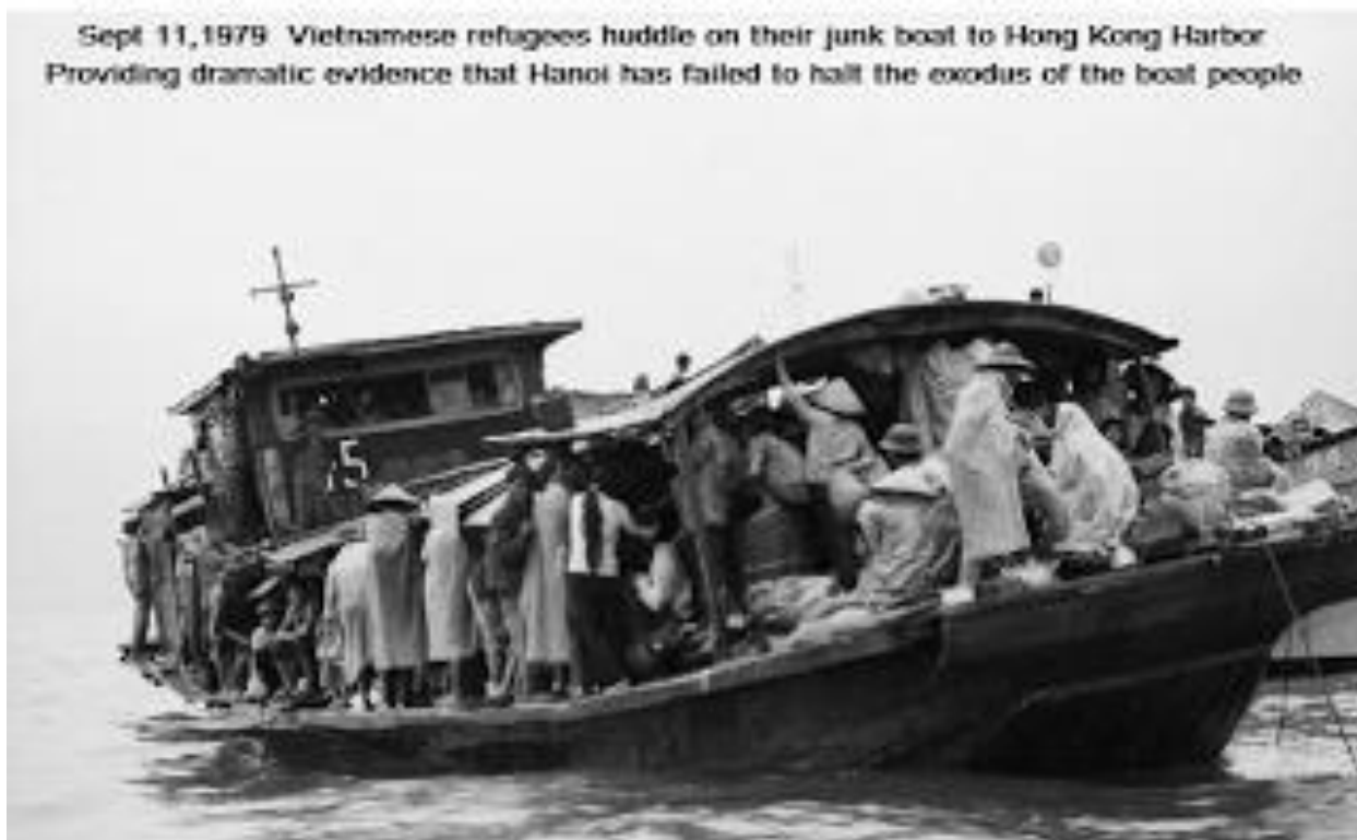
Thuyền nhân đang lên đênh tìm đường thoát khỏi cộng sản

Chính vì cướp sạch kinh tế, nhà cửa và đày đọa Quân Dân Cán Chính VNCH mà Đảng Cộng sản Việt Nam đã đẩy người dân Miền Nam tới nạn "Thuyền nhân" để kiếm tìm sự sống mới. Trên thực tế không chỉ có X1 và X3 đánh kinh tế, nhà cầm quyền Cộng Sản còn dùng X2 để