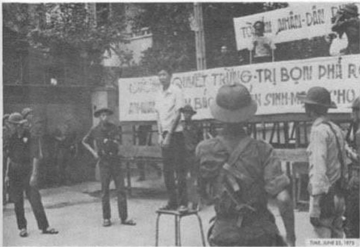
In Vietnam now, everything is expensive (difficult to get), but only the human life is cheap (easy to get). Ở Việt Nam hiện nay bất cứ cái gì cũng mắc mớ, duy có mạng sống con người là rẻ mạt.

Every person may be charged with a crime. Every crime may be sentenced to death. Tất cả mọi người đều có thể bị kết tội, và tất cả mọi tội đều có thể bị tử hình!