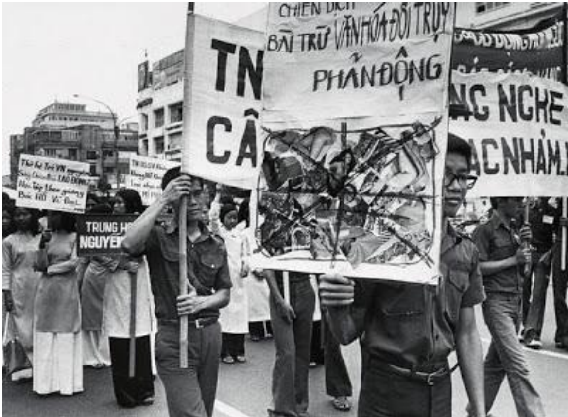
Bắt học sinh xuống đường "Bài trừ văn hóa phản động"