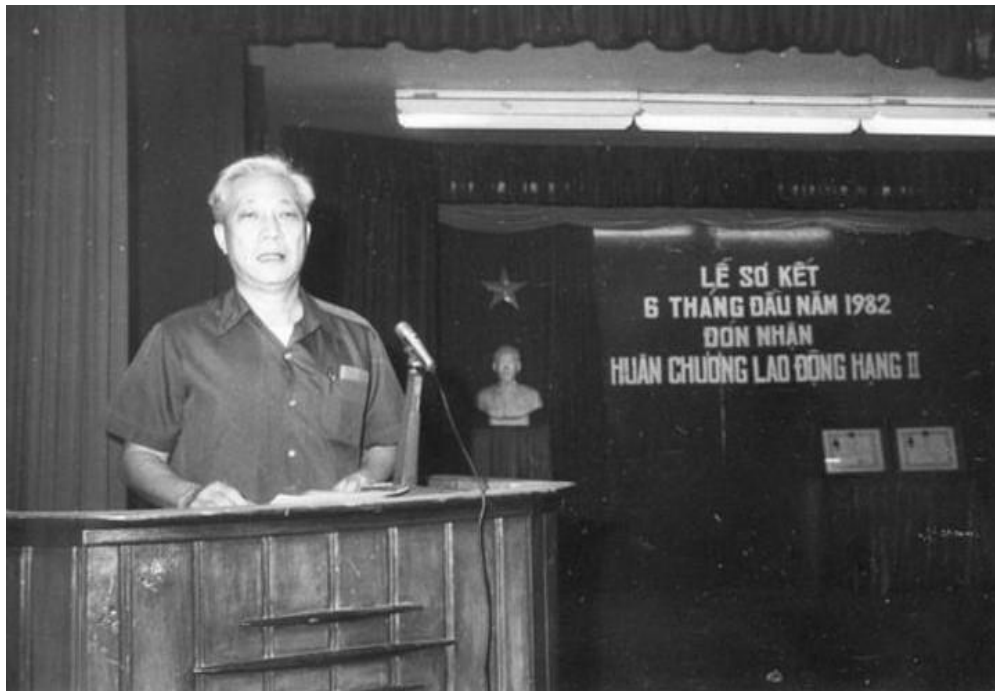
Đồng bào hãy nhớ đây là một tên cướp ngày