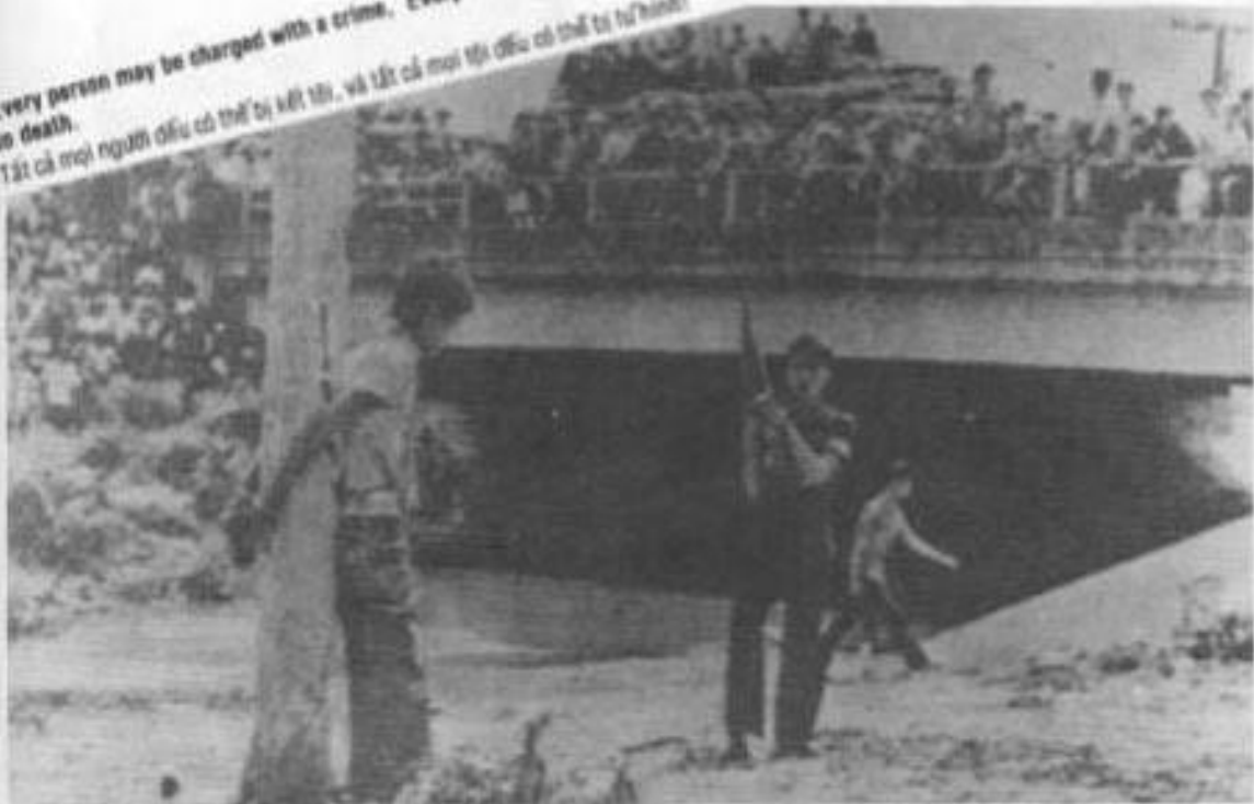
Và đây là điển hình cho cái gọi là "Tòa án nhân dân"

Every person may be charged with a crime. Every crime may be sentenced to death. Tất cả mọi người đều có thể bị kết tội, và tất cả mọi tội đều có thể bị tử hình!