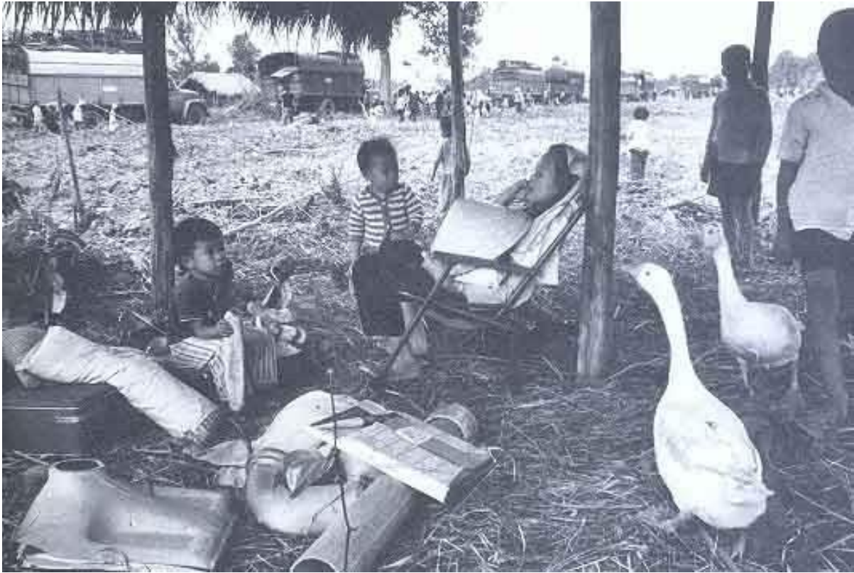
Dân đi Kinh tế mới sau 1975