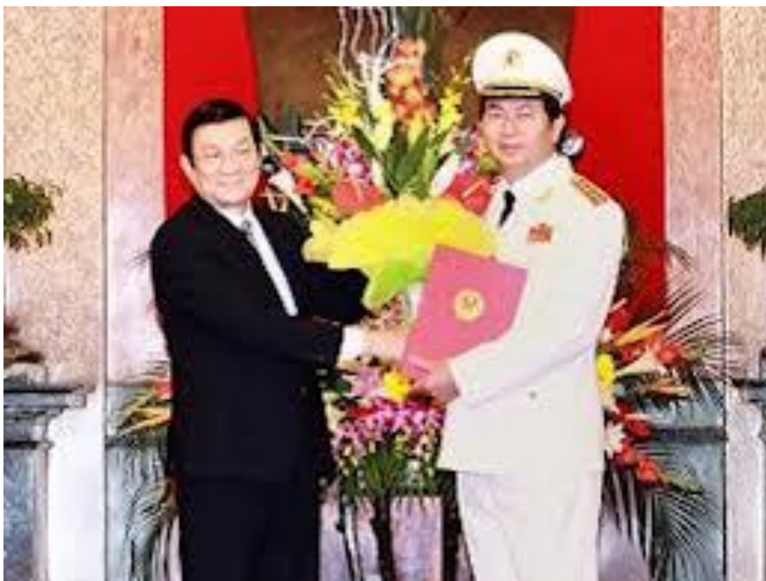
Trần Đại Quang và Tư Sang

miệng của Quang cho thấy sự việc khai man lý lịch của Quang là hoàn toàn thật sự cộng với những bằng chứng xác thực đã nêu trên từ hình ảnh bằng cấp của Quang.