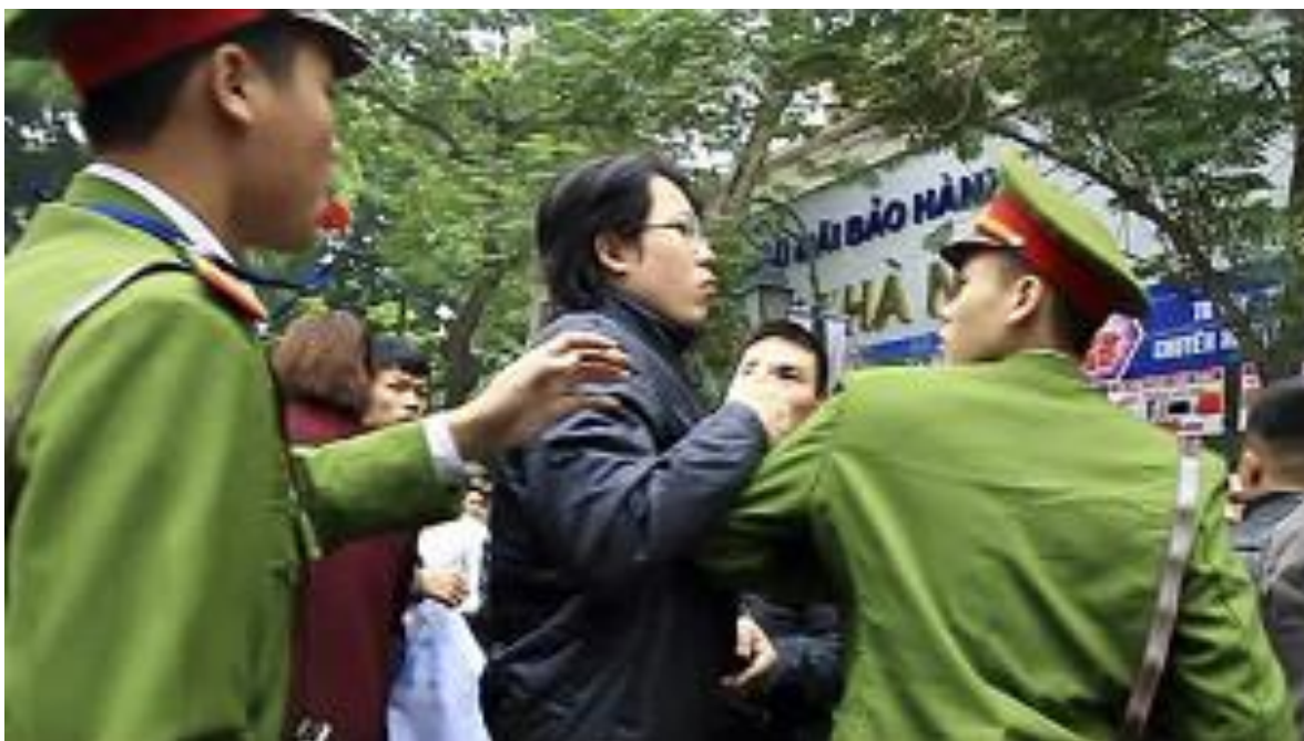
Đàn áp người dân

Việc phong Tướng cho ông Trần Đại Quang là đỉnh điểm của quá trình cất nhắc một loạt các Tướng lĩnh trong Bộ Công An, lực lượng mà Đảng Cộng Sản Việt Nam hiện nay xem là chỗ dựa chủ yếu để trấn áp các lực lượng chống đối đe dọa sự cai trị độc quyền của Đảng.” [9].