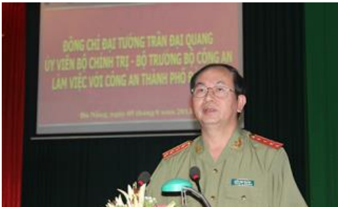
Trần Đại Quang khi thăm Đà Nẵng

Thứ hai , Để thấy bộ mặt ác với dân của Quang thì hãy nghe Quang nói gì với Công An – Côn đồ dưới quyền ông ta.