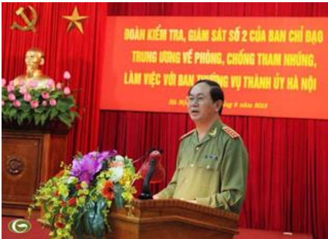
Trần Đại Quang trong 1 buổi làm việc tại Hà Nội

Và cuối cùng, bằng Chứng thư từ VOA cũng cho thấy điều đó: " Bộ trưởng Công An mới Trần Đại Quang gặp ngay một vụ bê bối được đưa lên báo là ông đã khai man trong giấy khai sinh