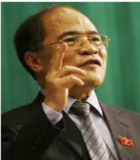
Nguyễn Sinh Hùng