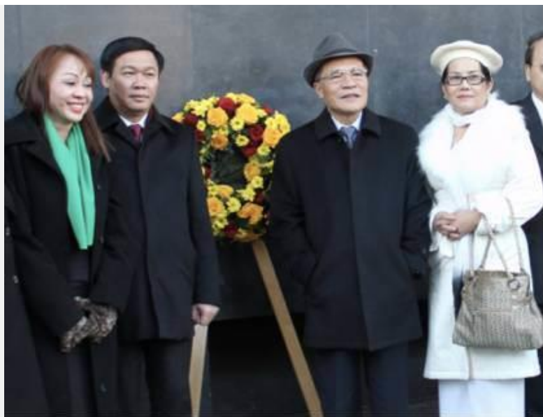
Hùng hói và cô vợ vốn là gái "tắm quất"