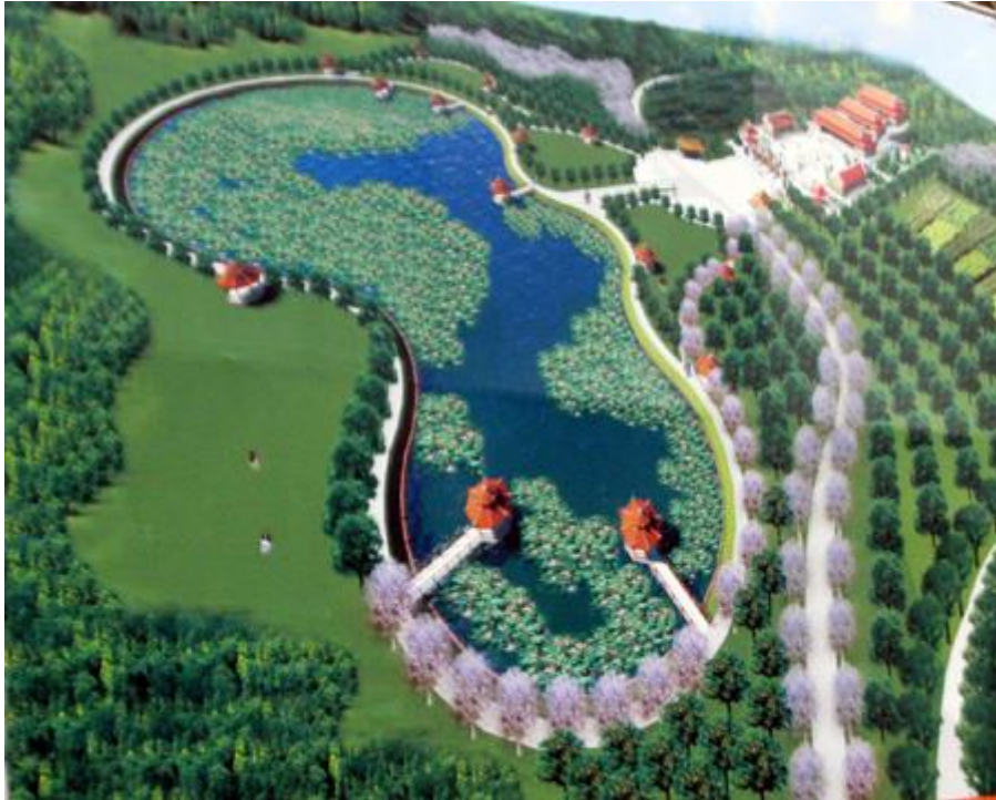
Phối cảnh khu đền thờ

đó là lý do vì sao tại Quốc hội khoá 3 này Thống đốc Bình đã thoát chất vấn cho dù rất nhiều bức xúc của cử tri cả nước gởi gắm Đại biểu của mình cần có câu trả lời khi chỉ một thời gian ngắn lên tại vị ở vị trí Thống đốc NHNN đã làm cho nền kinh tế bị suy thoái với việc xuất hiện hàng loạt những việc bất bình thường trong chính sách và trong thực hiện tái cấu trúc ngân hàng mà dư luận cả nước xôn xao về sự chi phối bởi nhóm lợi ích ... Tiếp theo, để trả công, chính bà Thái Hương là người đã và sẽ bỏ ra 150 tỷ đồng xây dựng đền thờ Tổ cha mẹ Hồ Chí Minh.