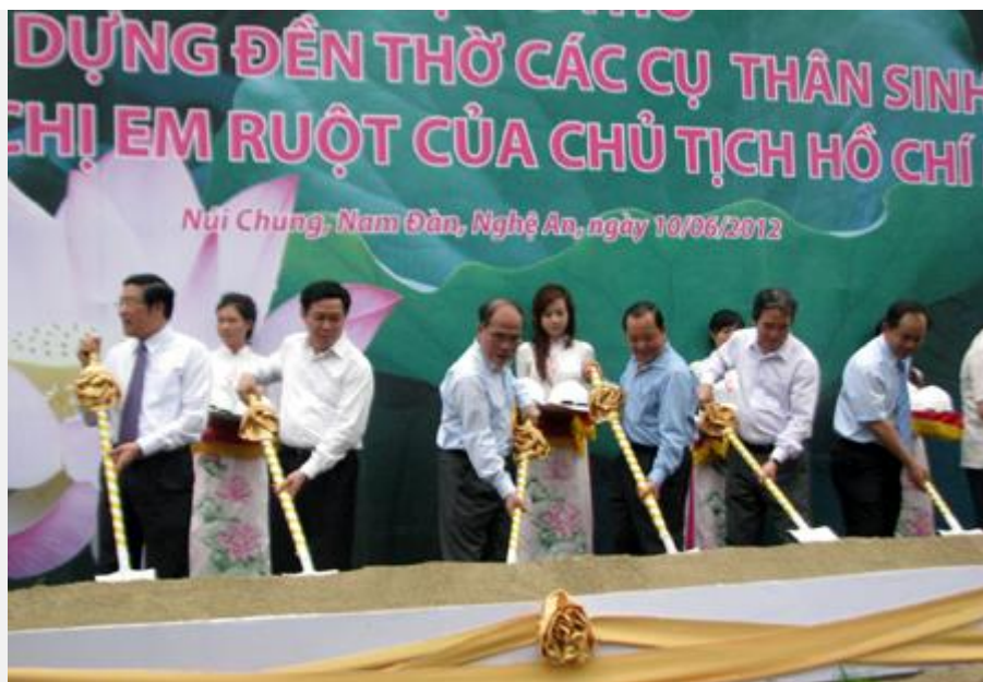
Hùng hói tại lễ khởi công đền thờ khủng