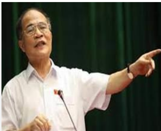
Hùng hói tham nhũng và dốt nát

Đây là bằng chứng cho thấy thái độ vô trách nhiệm của Hùng hói trước những đồng tiền thuế của dân đang trôi theo bọt nước.