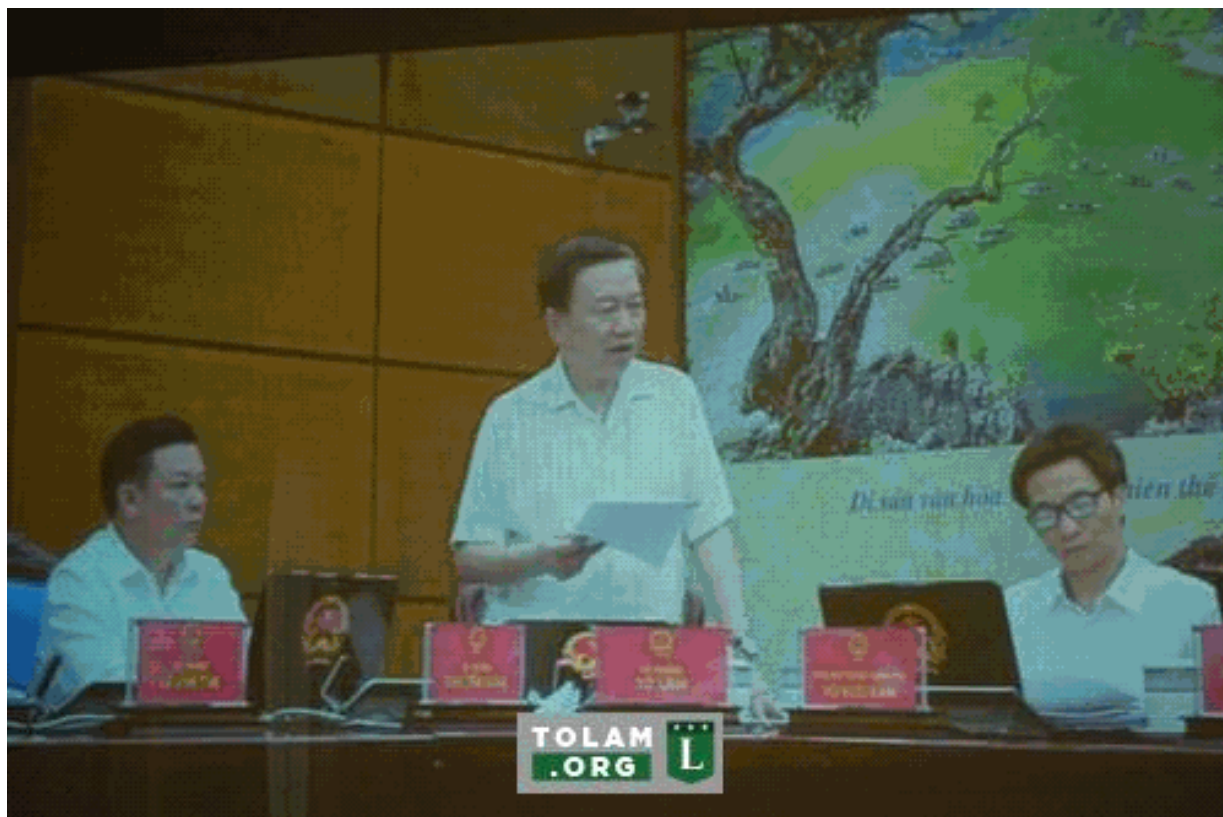
Tô Lâm tại cuộc họp 01/07/2016 – ngồi cạnh là Vũ Đức Đam.

Như chúng ta đã biết, vụ án Formosa xả thải gây ô nhiễm môi trường biển miền trung chính thức bùng nổ từ tháng 4/2016. Nhưng 3 tháng sau đó, vào chiều 01/07/2016 phát biểu tại phiên họp thường kỳ của Chính phủ, Thượng tướng Tô Lâm, Bộ trưởng Bộ Công an đã nói: “Cần phải bảo vệ Formosa trước mọi âm mưu xuyên tạc của thế lực thù địch” . Với cương vị là một bộ trưởng công an nắm trong tay cảnh sát môi trường. Nhưng Tô Lâm không xử lý hình sự công ty này mà còn báo cáo là phải bảo vệ tập đoàn giết hại môi trường và con người Việt Nam. Vậy thì Tô Lâm đích thực là một tên tay sai cho Tàu cộng không thể khác được.