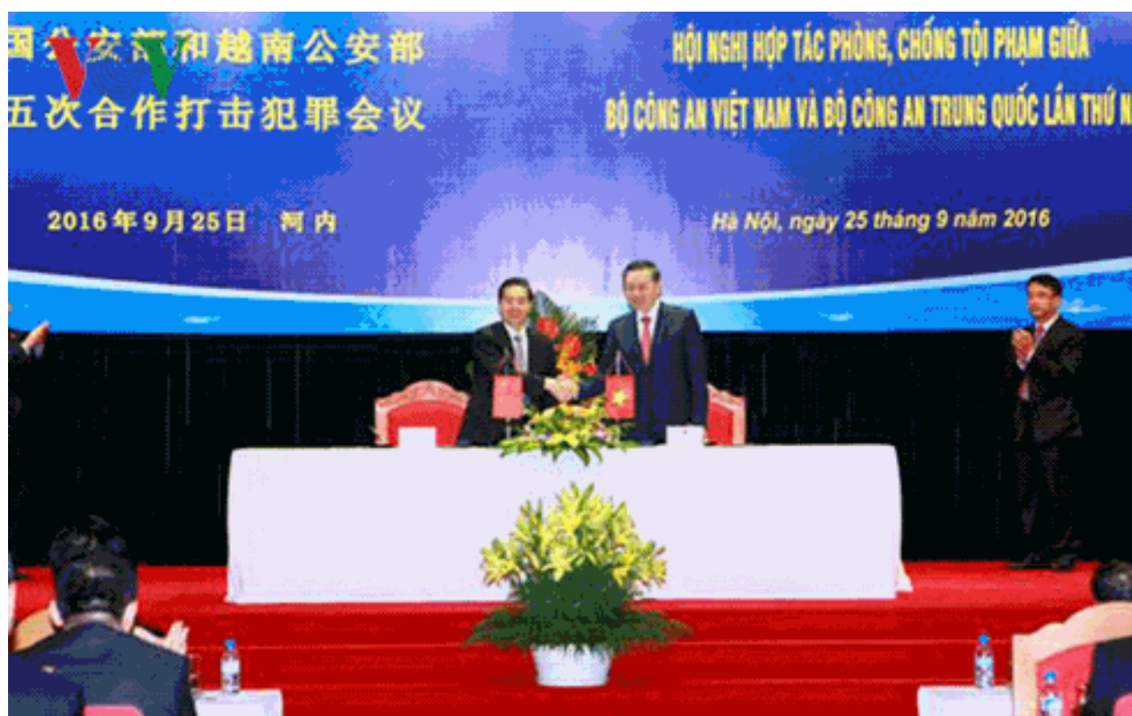
Tô Lâm tiếp bộ trưởng công an Tàu cộng

Tại hội nghị này, Tô Lâm ký kết rất nhiều văn kiện với sứ Tàu. Đặc biệt Tô Lâm cũng cam kết với Quách Thanh Côn trong việc bảo vệ Formosa như là một đứa con của Tàu cộng tại Việt Nam.